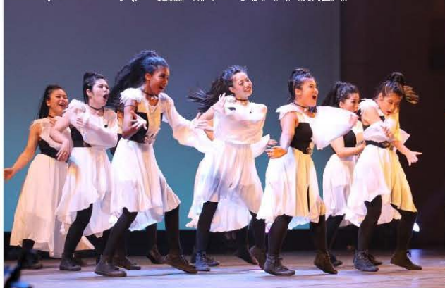
2015年 スモールクラス優勝 精華女子高等学校(福岡)